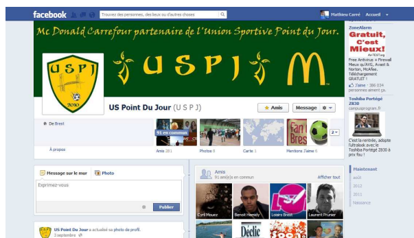
Aperçu de la page du club : www.facebook.com/uspj.foot