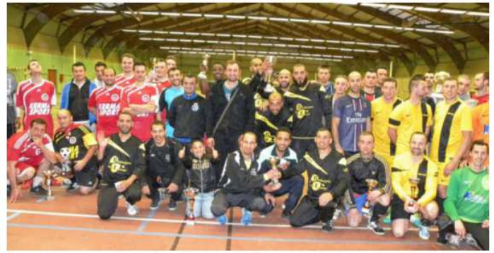
Une partie des joueurs, tout heureux des trophées et coupes qu'ils ont remportés.

La saison de football en salle FSGT s'est terminée jeudi soir, au stade du Petit-Kerzu, par les demi-finales et finales des coupes. Huit équipes représentant 80 joueurs, ainsi qu'une foule de supporters enthousiastes, étaient présentes. Toute la soirée, dans une ambiance extraordinaire, la grande halle des sports a retenti des vivas des supporters et des participants.