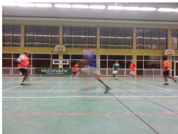
Visibilité du partenariat avec le Mc Donald's Le Point du Jour.